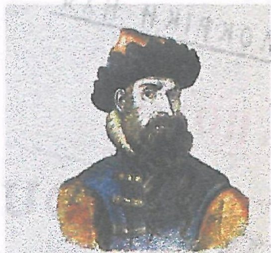
Τον 15ο αι. ο Γερμανός αγγράφος Ιωάννης Γουτενβέργιος επινόησε μέθοδο τυπογραφίας με κινητά μεταλλικά στοιχεία (γράμματα) και τρόπο κατασκευής τους σε μεγάλες ποσότητες.